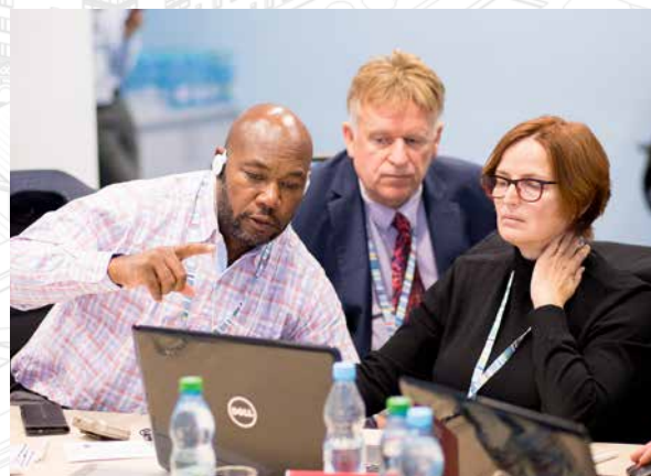
Homologation internationale du simulateur